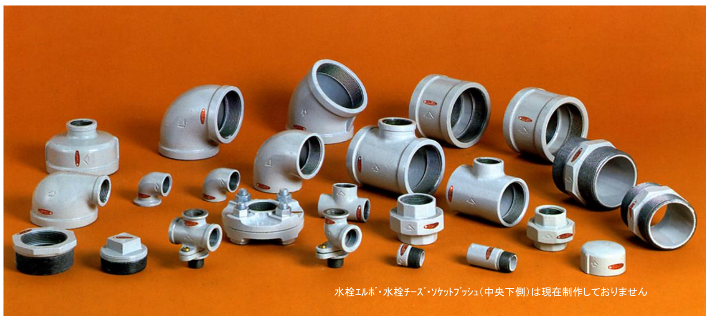
水栓エルボ・水栓チース・ソケットブッシュ(中央下側)は現在制作しておりません